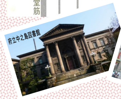
府立中之島図書館