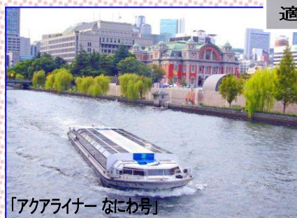
「アクアライナー なにわ号」