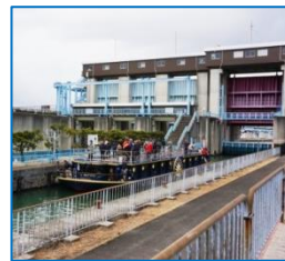
水位調整の為 閘室で待機