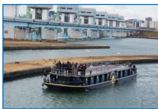
淀川側から毛馬閘門へ 向かう水路（後ろには淀川大堰）

大川と淀川の分岐点にある「毛馬閘門」により、淀川本流での洪水や土砂の流入を防ぎ、市内を流れる大川は安定した水量を保っています。普段観光船はこの毛馬閘門を通過する事はありませんが、このクルーズでは貴重な体験をする事ができます。（ガイドスタッフが乗船します）