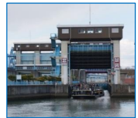
大川側の閘門が 開き、大川へ